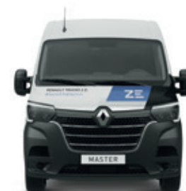
RENAULT TRUCKS MASTER Z.E.