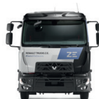
RENAULT TRUCKS D Z.E.