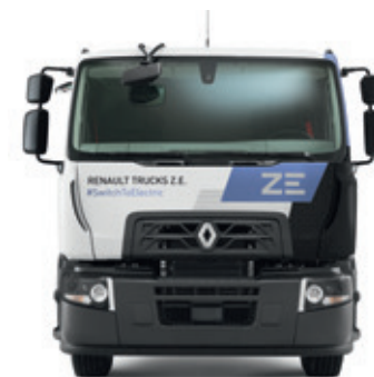
RENAULT TRUCKS D WIDE Z.E.